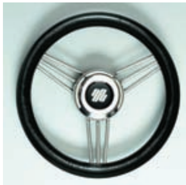
Ø 350 mm Материал зоны для хвата: полиуретан. Стальные спицы