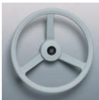
Ø 335 mm Материал: ударопрочный термопластик