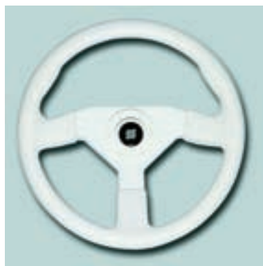
Ø 342 mm Материал: ударопрочный термопластик