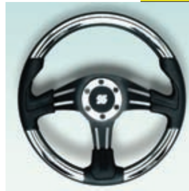
Ø 350 mm Чёрный эргономичный пластик. Хромированные вставки