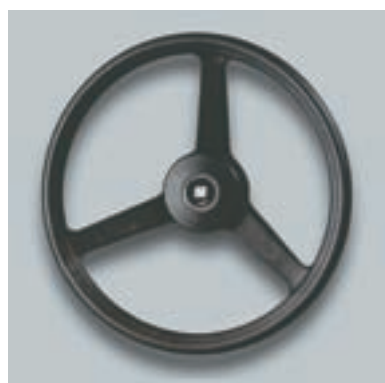
Ø 335 mm Материал: ударопрочный термопластик