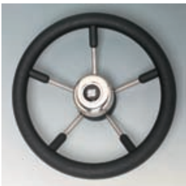
Ø 350 mm Материал зоны для хвата: полиуретан. Немагнитная сталь