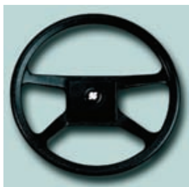
Ø 342 mm Материал: ударопрочный термопластик