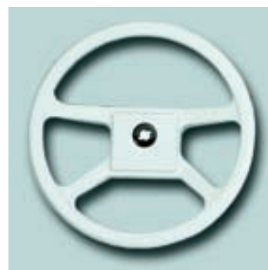
Ø 342 mm Материал: ударопрочный термопластик