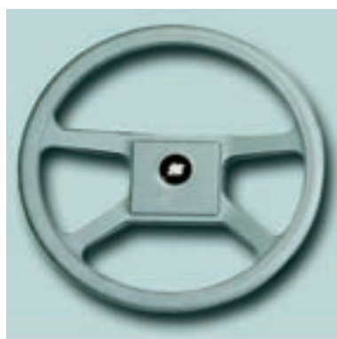
Ø 342 mm Материал: ударопрочный термопластик