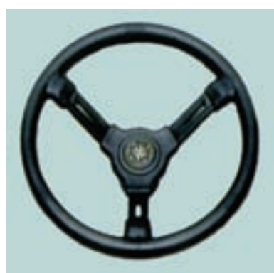
Ø 350 mm Материал: ударопрочный термопластик