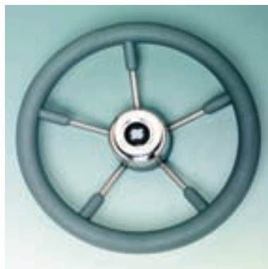
Ø 350 mm Материал зоны для хвата: полиуретан. Немагнитная сталь