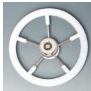
Ø 350 mm Материал зоны для хвата: полиуретан. Немагнитная сталь