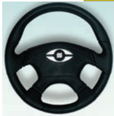
Ø 360 mm Материал зоны для хвата: полиуретан