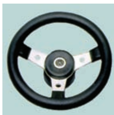
Ø 350 mm Материал: ударопрочный термопластик