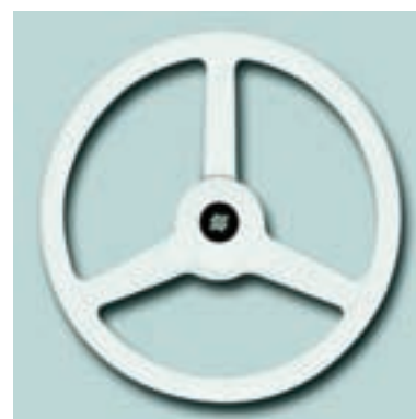
Ø 335 mm Материал: ударопрочный термопластик